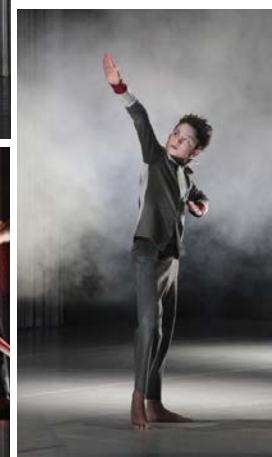
© Léo Ballami / Cécile Martini