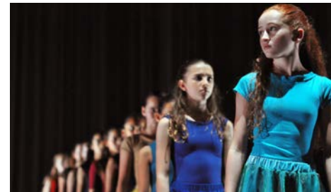
© Léo Ballami / Cécile Martini