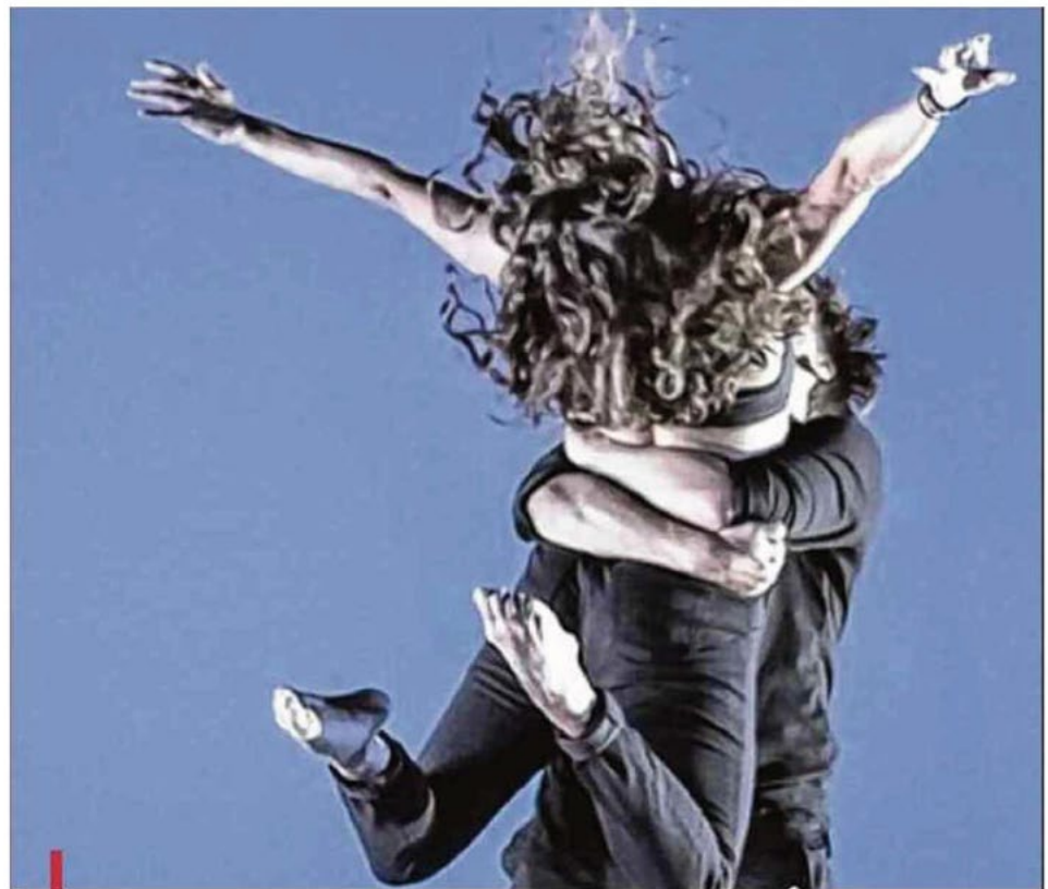
"Inventaire" de Josette Baiz, à voir du 10 au 20 juillet aux Hivernales. Quand la compagnie Grenade raconte avec humour le destin d'une danseuse et d'un danseur...

Pléthorique, atypique, frénétique: la programmation de ces Hivernales d'été est une fois encore une magnifique invitation