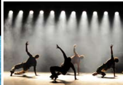
© L. Ballani et C. Martini