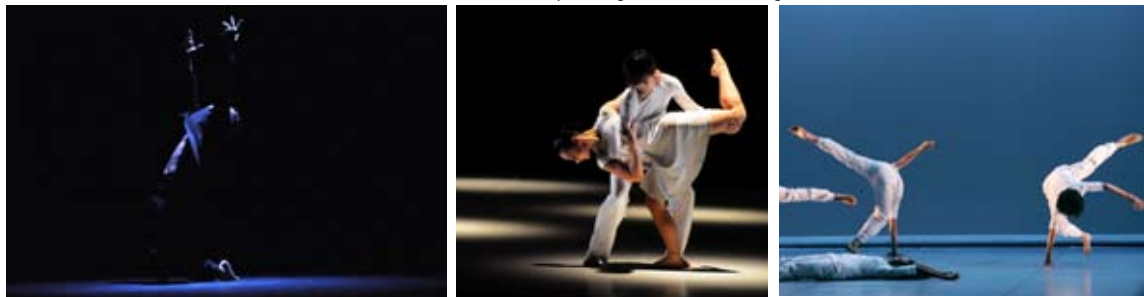
«L'Evocation», Damien Jalet ; «Déserts d'amour», Dominique Bagouet ; «Hommage à Trisha», Josette Baiz