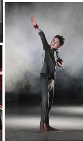
© Léo Ballami / Cécile Martini