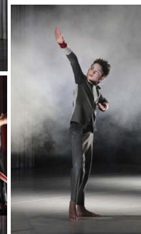
© Léo Ballani / Cécile Martini