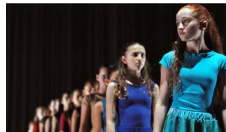
© Léo Ballani / Cécile Martini