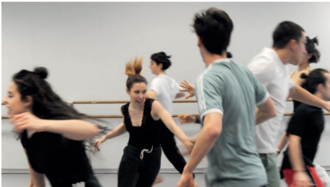
Kamuyot d'Ohad Naharin par la Cie Grenade - répétitions

Ohad Naharin, l'inventeur du mouvement Gaga, a créé une pièce singulièrement joyeuse et loufoque, pour toutes les générations. Il en offre le génie et l'énergie à la Compagnie Grenade, un ensemble de jeunes professionnels, qui dansent avec panache et excellence. Kamuyot est une fête où se tissent même de furtives amitiés entre danseurs et spectateurs., elle en réinvente et redistribue l'énergie, aussi communicative que festive.