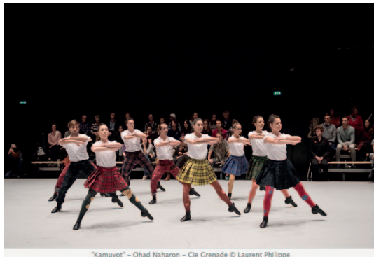
"Kamuyot" - Ohad Naharin - Cie Grenade

Avec Kamuyot, Ohad Naharin s'adresse aux jeunes et il le fait savoir. Dans une bande son très éclectique, on distingue un moment où deux musiques se succèdent et forment comme une invitation: « Children of Israel » (sur une boucle dub) - « Do ya wanna dance ? » (en rock'n'roll). Sur ça, chaque danseur amène des enfants sur le plateau, pour quelques instants. D'abord un, puis deux, puis trois, et finalement quatre. La rencontre est festive, la construction limpide, l'esprit joyeux, dans un langage chorégraphique qui ressemble à une mosaïque, aussi bigarrée que la société israélienne.