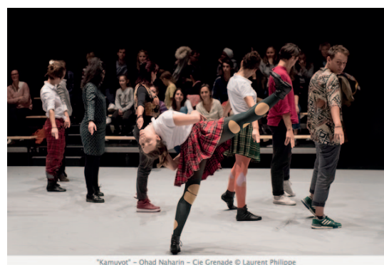
"Kamuyot" - Ohad Naharin - Cie Grenade

https://dansercanahistorique.fr/?q=content/kamuyot-d-ohad-naharin-par-la-cie-grenade