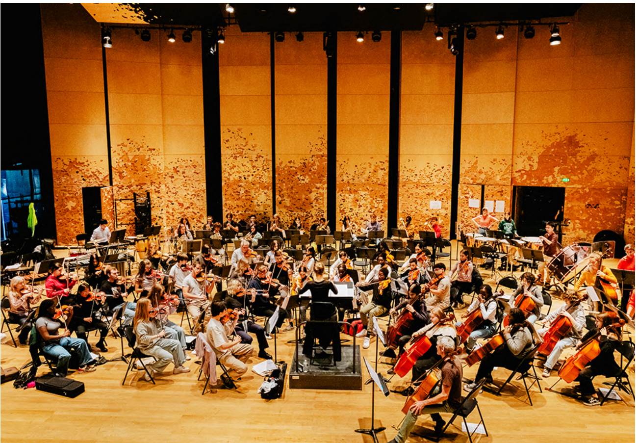
Orchestre D emos © DR D emos/Philharmonie de Paris