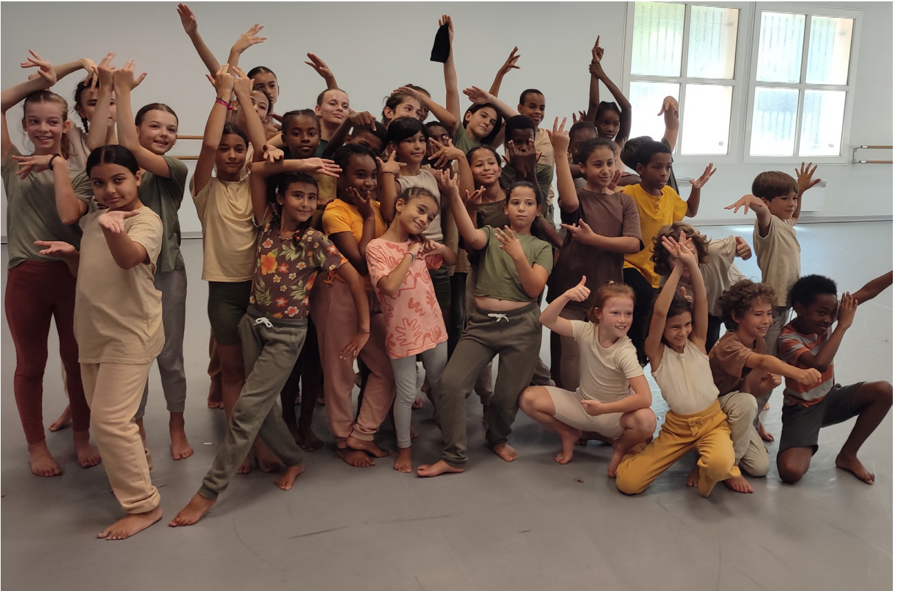
Groupe Grenade © S.Soubra